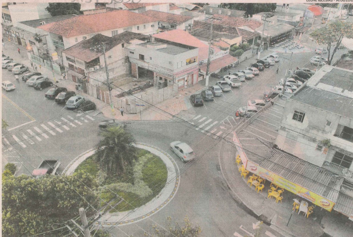
CRUZAMENTO das ruas Joaquim Lírio e João da Cruz: região terá nova iluminação e calçadas mais largas