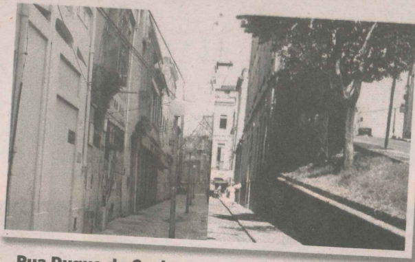
Rua Duque de Caxias

Na próxima quarta, ela lança no Augustus Botequim a coleção “Resgatando o Passado e Refletindo o Futuro”, composta por 18