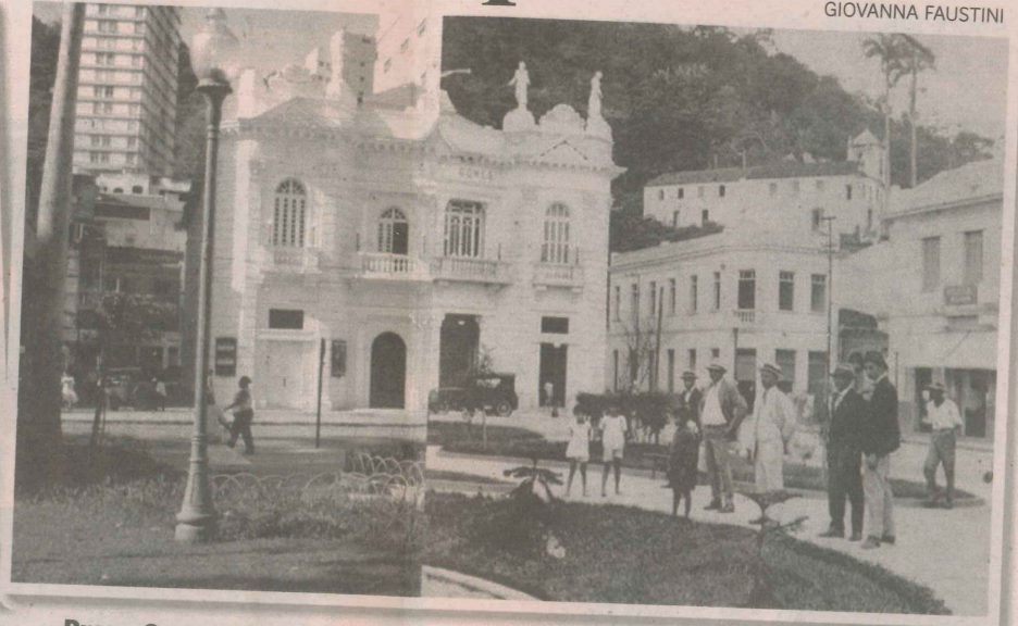
Praça Costa Pereira

Fotógrafa vai distribuir gratuitamente nove mil cartões com imagens do bairro