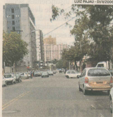
RUA DAS PALMEIRAS, em Vitória