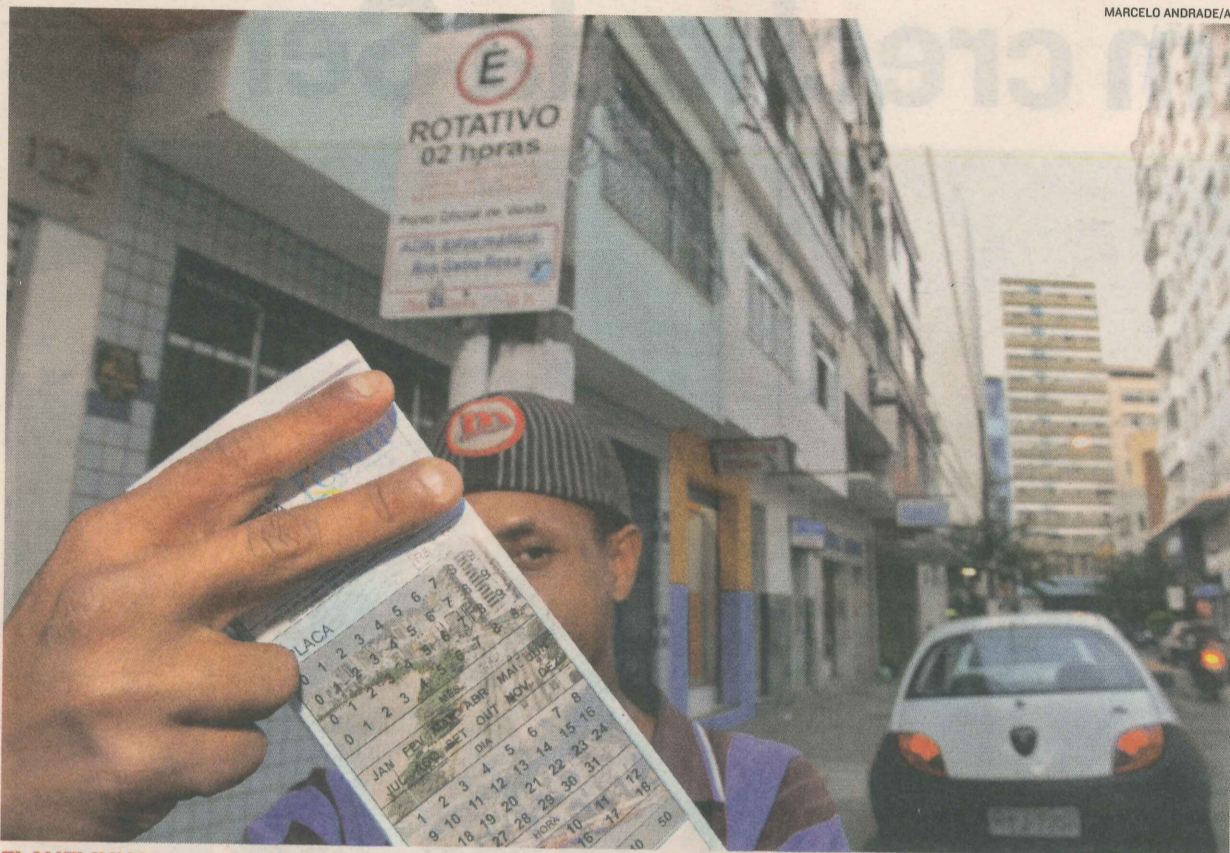
FLANELINHA que trabalha no centro de Vitória admite que vende cartão de rotativo mais caro para os motoristas