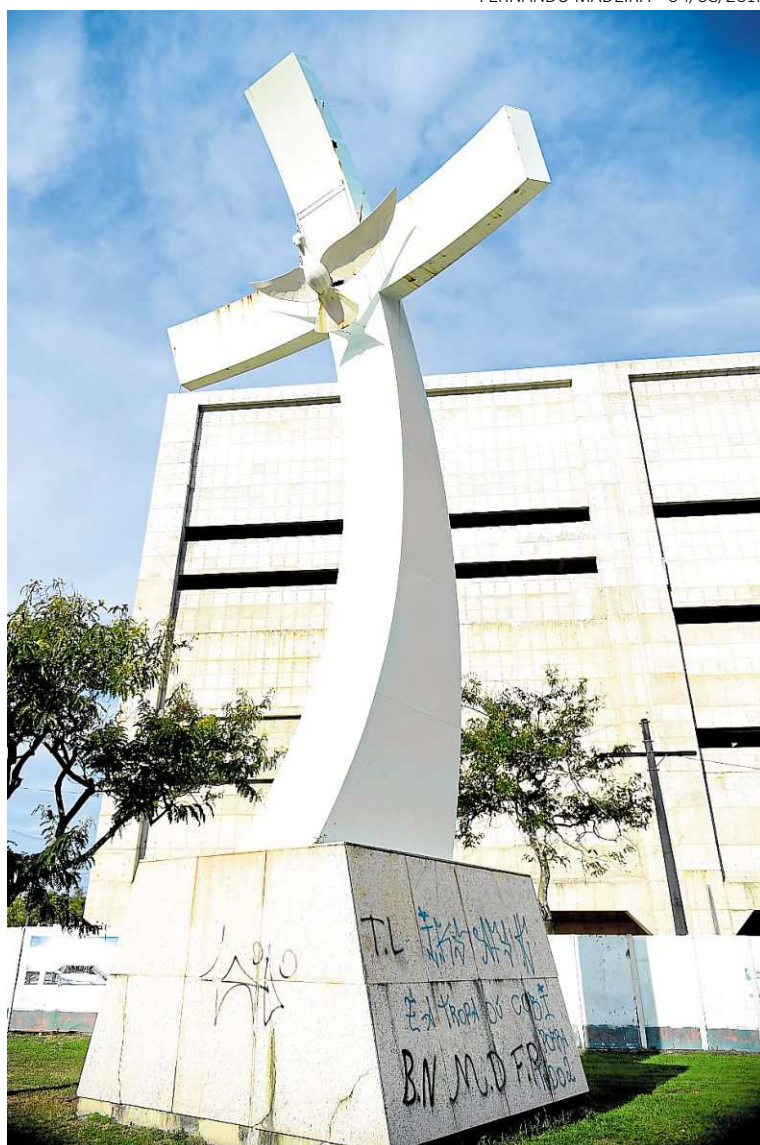
A base de sustentação da Cruz do Papa pichada na quinta-feira (esquerda) e ontem, após a limpeza (direita)

Na quinta-feira, inclusive, a reportagem havia flagrado ontem um usuário de drogas no local, que abraçava muita sujeira por todos os cantos e havia muitas fezes e latas queimadas.