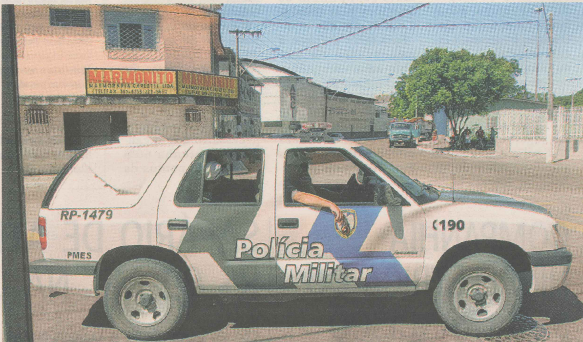
REPRESSÃO. Moradores querem que o bairro seja monitorado pela Polícia Militar para evitar a ação de traficantes, que usam a região para vender e usar drogas.

TOME NOTA: Amanhã, conheça os orgulhos dos moradores do Ibes.