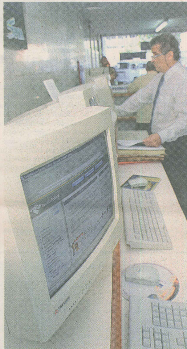
REAJUSTE. As taxas de juros variam de 2,50% a 4,70% ao mês.

Se a idéia for usar o crédito para comprar produtos, é melhor esperar a restituição para fazer a compra à vista. O valor da restituição é corrigido pela taxa Selic, a partir de maio até o mês da liberação. Embora as taxas de juros cobradas pelos bancos nessa linha de crédito sejam mais baixas que as de outras modalidades, o custo poderá ficar elevado se o contribuinte cair na malha-fina. Nesse caso, o banco chama o cliente para renegociar a dívida, aumentando o prazo, mas com juros mais altos.