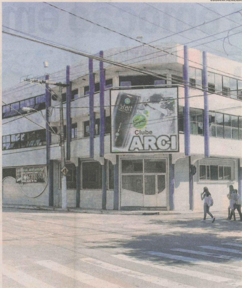
O CLUBE Arci foi fundado em 1963, a partir de uma ideia de 42 amigos

“Antigamente as pessoas iam a um clube mesmo não gostando do