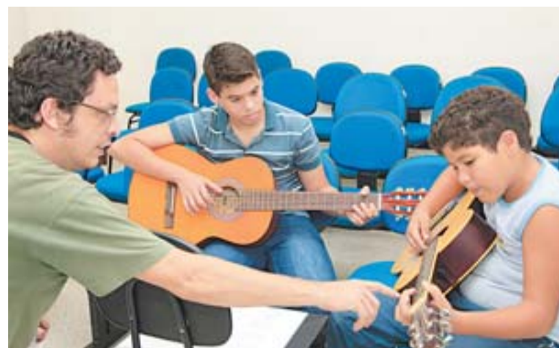
CURSO DE VIOLÃO: investimento em atividades extracurriculares

Todos os anos os Jogos Estudantis da Serra reúnem milhares de alunos nas mais diversas modalidades esportivas. Os jogos promovem a integração dos alunos e estimula a vida saudável.