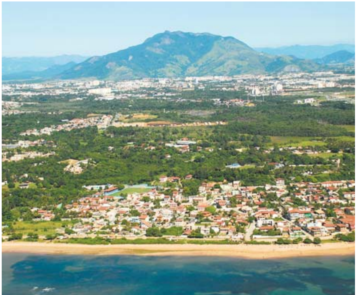
MAR E MONTANHA cercam o município que mais cresce no Estado e que se prepara para um futuro planejado

Intitulado Serra Agenda do Futuro 2012 – 2032, esse planeja-