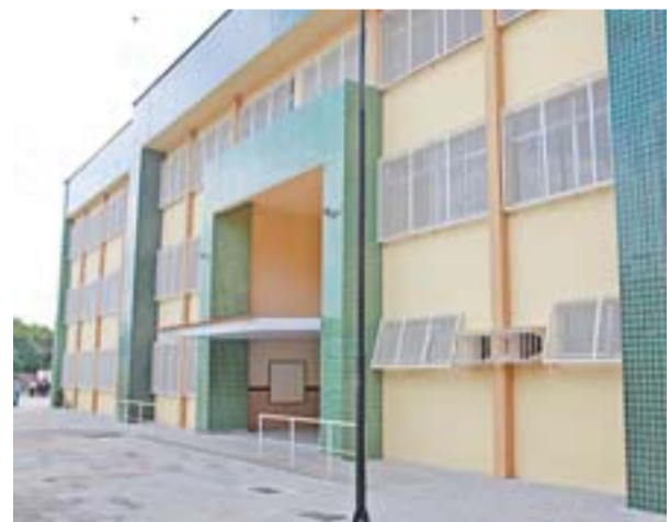
ESCOLA DE ENSINO FUNDAMENTAL de José de Anchieta II: novo espaço de aprendizagem para os estudantes