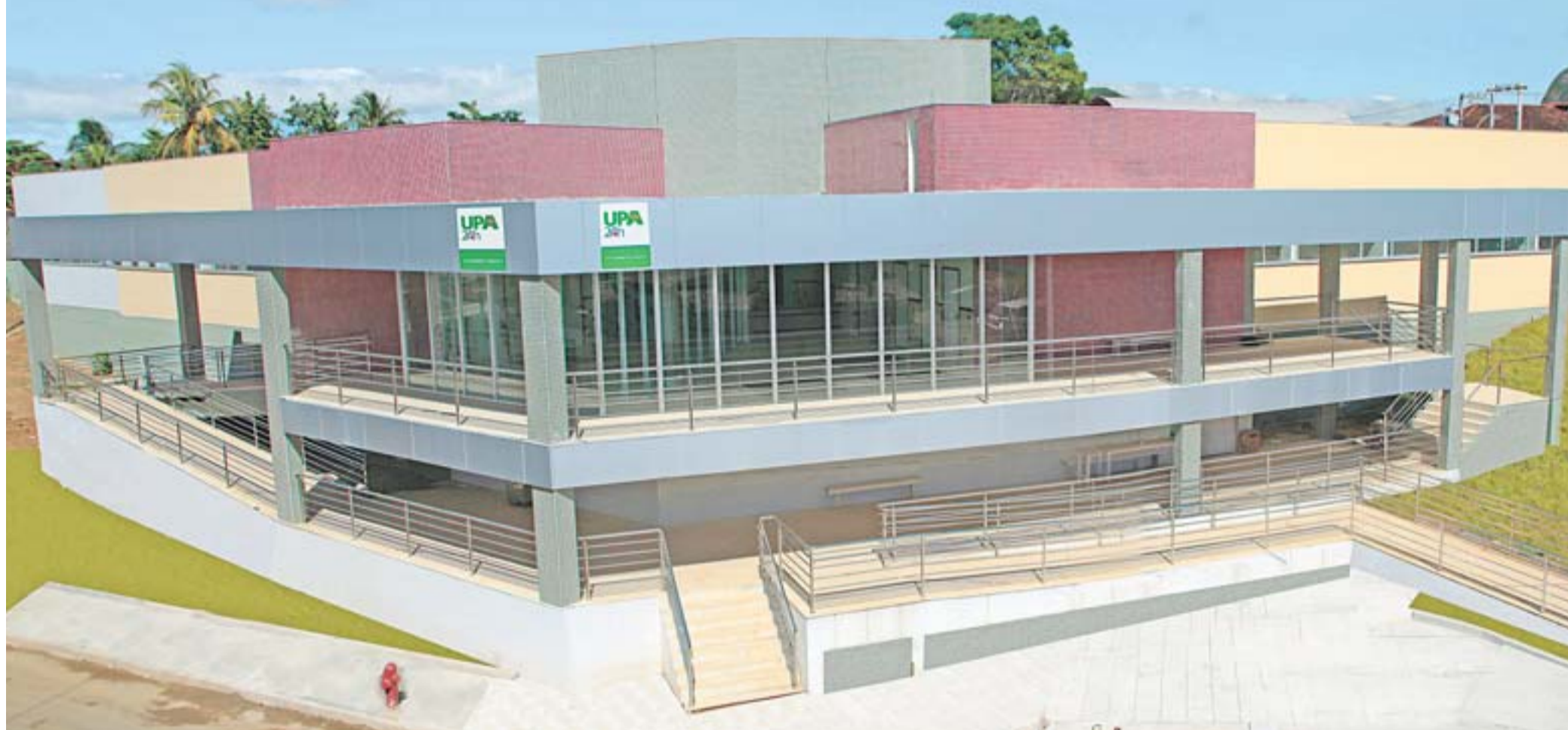
NOVA UNIDADE DE PRONTO ATENDIMENTO que começa a funcionar na Serra-Sede. É a décima inaugurada nos últimos quatro anos e a segunda com atendimento 24 horas

O município que mais cresce no Estado conta com uma agenda de longo prazo, que traça ações até 2032, sem tirar o olho do presente.