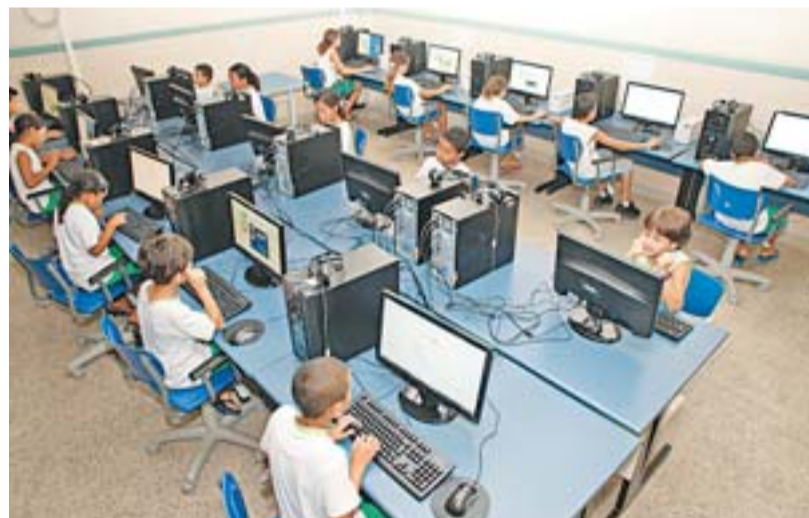
AULA DE INFORMÁTICA: infraestrutura para um ensino de qualidade

O município também disponibiliza o Projeto Universidade para Todos (Pupt/Serra), em parceria com a Ufes. O objetivo é preparar moradores, que não podem pagar um cursinho, para concorrerem a uma vaga no vestibular. Na Serra, o Pupt acontece em seis bairros, reunindo, em média, mais de 500 alunos.