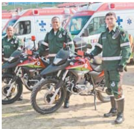
MOTOLÂNDIAS pilotadas por enfermeiros