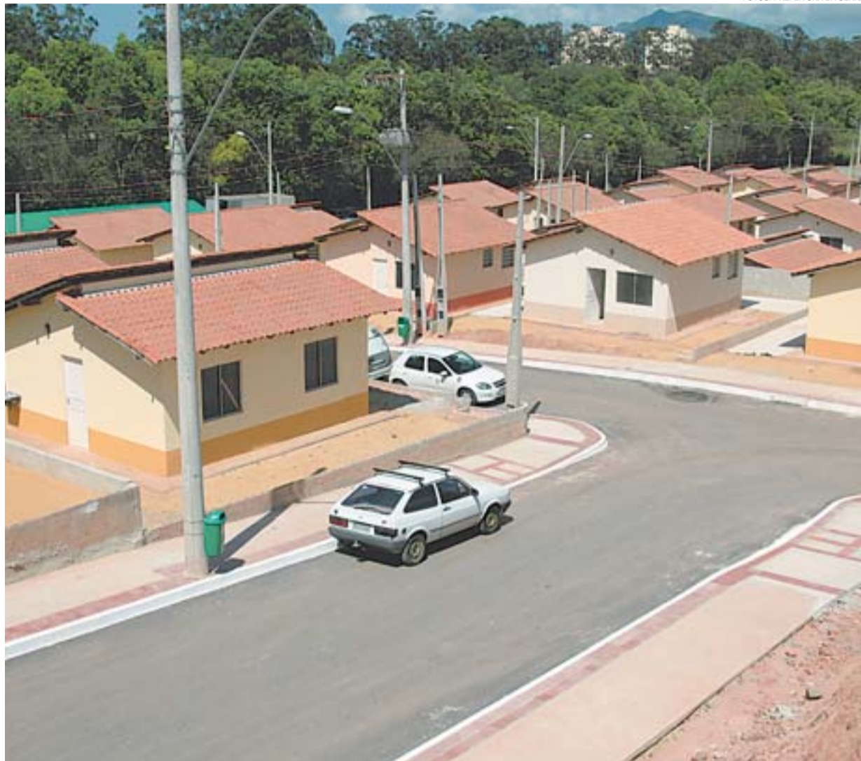
COSTA DOURADA, EM JACARAÍPE, recebeu da prefeitura um conjunto habitacional com 78 residências

Quem for contemplado pagará, ao longo de 10 anos, prestação mensal variando entre R$ 50 e R$ 160. Famílias com renda de um sa-