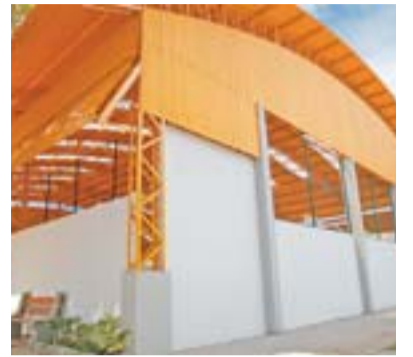
GINÁSIO poliesportivo de Camará