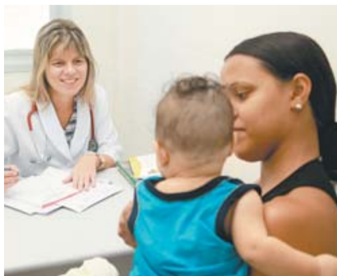
MAIS MÉDICOS para atender à população