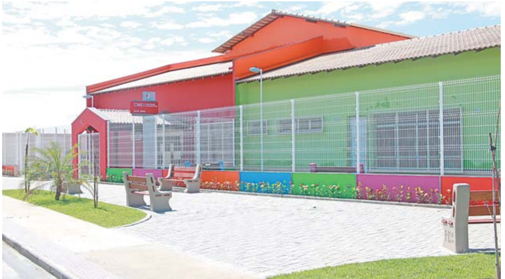
CENTRO MUNICIPAL de Educação Infantil (Cemei) de Feu Rosa: ampliação da rede de ensino no município para atender a demanda de novos estudantes