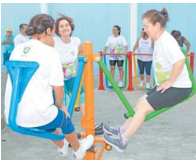
ACADEMIAS DE SAÚDE distribuídas pelos bairros