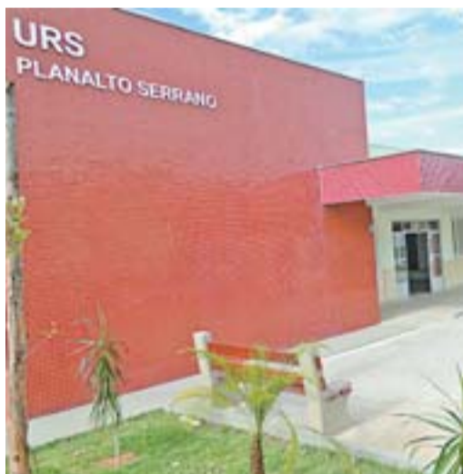
POLICLÍNICA de Planalto Serrano