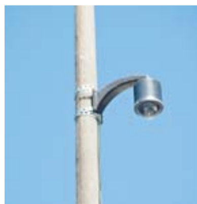
CÂMERA: redução da criminalidade