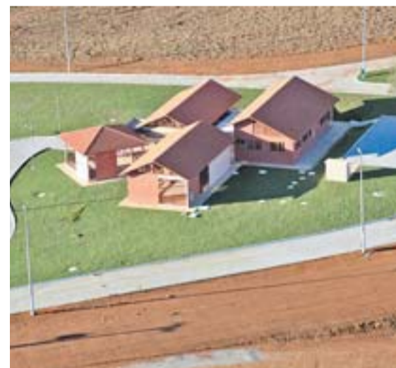
CENTRO de Recuperação de Dependentes Químicos