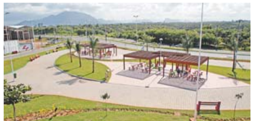
PRAÇA EM VILA NOVA DE COLARES está entre as obras entregues

A Lei Roberto Siqueira Costa consiste no incentivo à prática desportiva e na realização de convênios e programas de cooperação mútua entre ligas, clubes, associações e atletas do esporte amador e olímpico residentes no município.