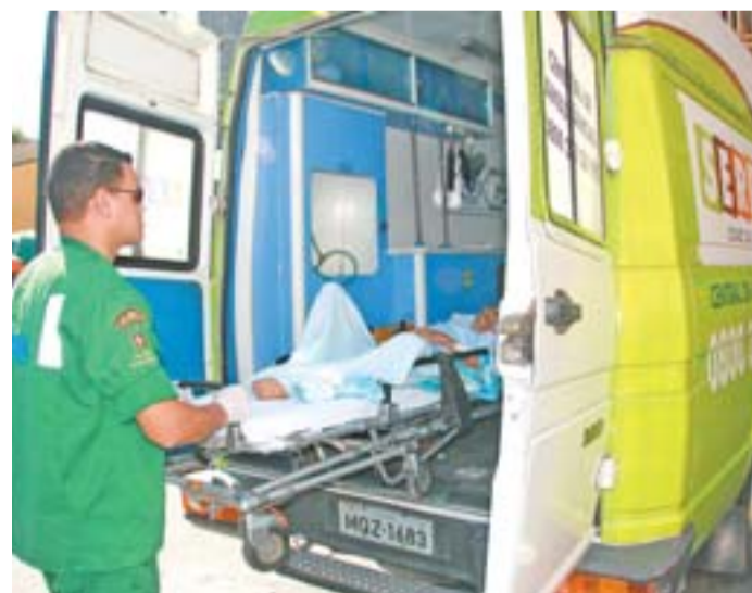
CENTRAL DE AMBULÂNCIAS com atendimento 24 horas