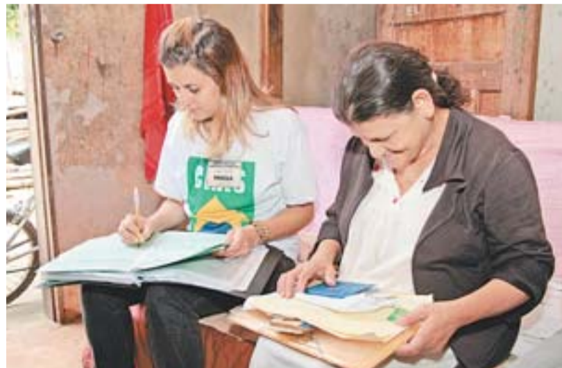
CRAS ITINERANTE chega nas casas dos moradores levando mais cidadania

Além do Cras itinerante, no município da Serra há nove unidades fixas de atendimento. Entre as atividades oferecidas, estão oficinas socioeducativas, palestras, cursos, visitas domiciliares, entre outros. No primeiro semestre de 2012, foram realizados 8.913 atendimentos nos Cras do município.