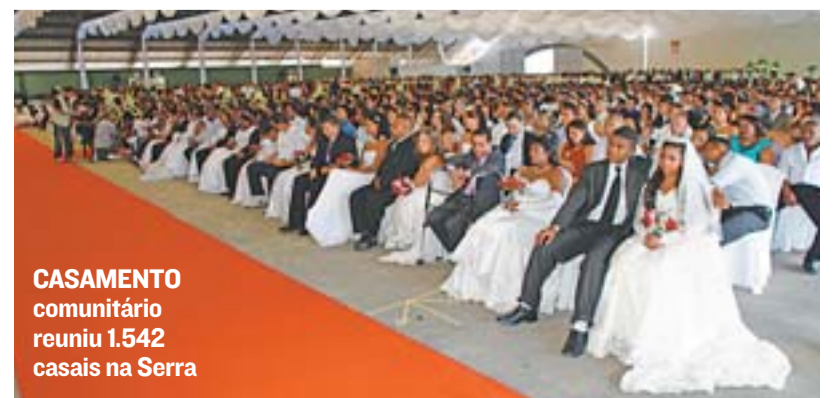
CASAMENTO comunitário reuniu 1.542 casais na Serra

Em quatro anos, a administração municipal fez mais de 29 mil atendimentos nos Plantões Emergenciais, que incluem auxílio-funeral, cesta básica emergencial, fralda geriátrica, fralda infantil, leite especial, óculos, passagem, entre outros. O trabalho é acompanhado por assistentes sociais.