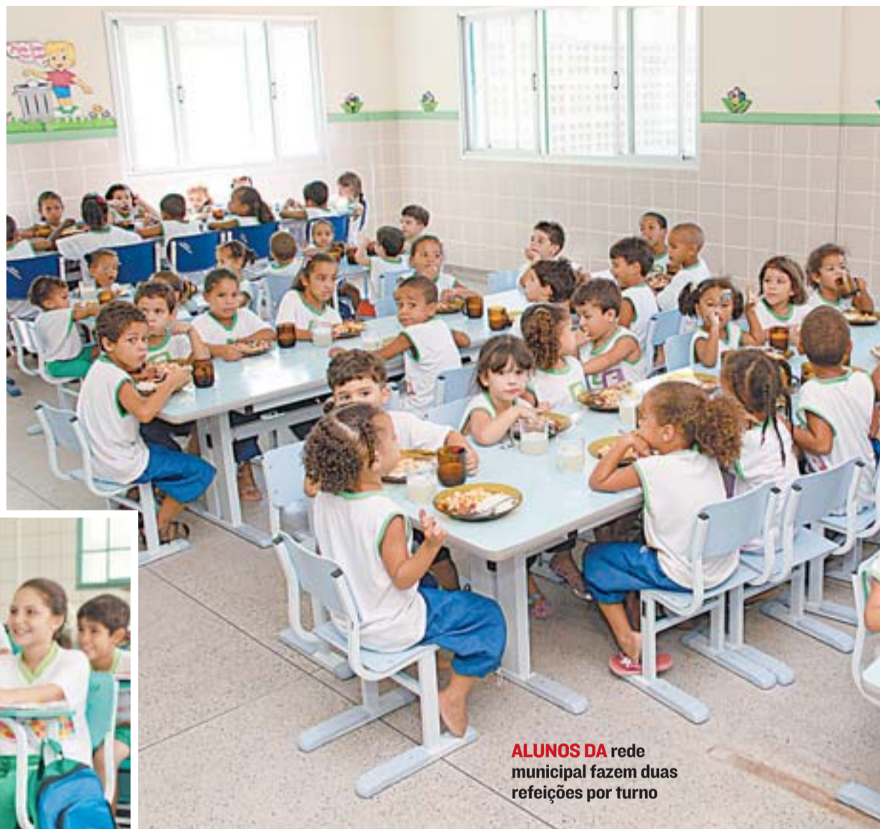
ALUNOS DA rede municipal fazem duas refeições por turno

O projeto também oferece cursos online gratuitos, que podem ser feitos por cidadãos de qualquer lugar do Brasil e de outros países. Os cursos possuem temas variados: Preparatório para o Enem,