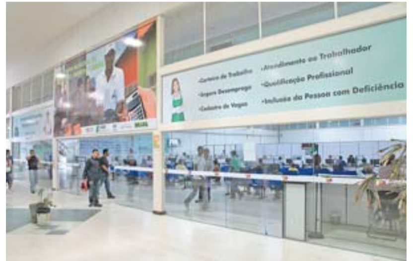
SINE da Serra: foram mais de 200 mil atendimentos ao trabalhador

EMIÇÃO DE CARTEIRA DE TRABALHO: 29,4 mil