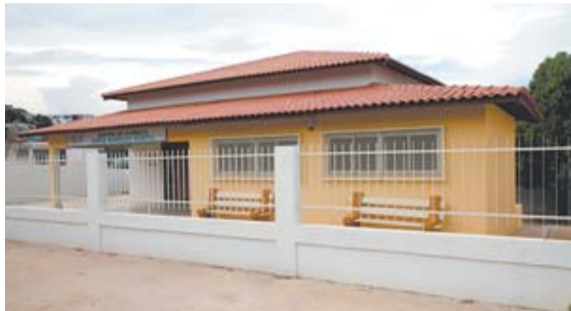
CENTRO DE VIVÊNCIA OFERECE cursos e atividades de lazer e cultura

O bairro de Laranjeiras recebeu uma das mais modernas praças inauguradas no município, em junho de 2010. A Praça da Luz foi erguida com um moderno projeto arquitetônico. São quatro deques que adentram ao lago cortado por uma ponte, tendo em suas pontas pergolando com bancos. A área de lazer conta ainda com mobiliário urbano, bicicletário, pavimenta-