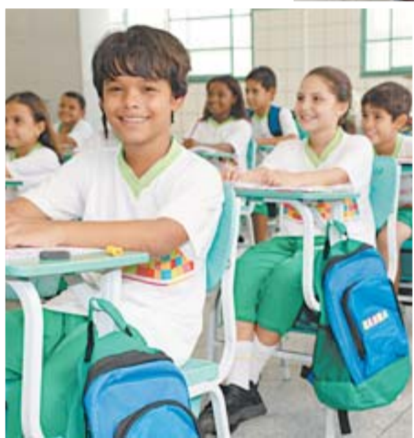
ALUNOS TÊM aulas de cidadania e educação fiscal nas escolas

A administração municipal investe na formação dos professores. Todos passam por cursos que são realizados num local apropriada para esta formação, em Bairro de Fátima. Os cursos atendem as áreas de atuação do magistério e a questões atuais, como igualdade