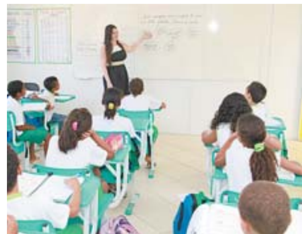
COM A AJUDA DO Poder Judiciário, a evasão escolar na rede municipal de ensino foi de apenas 0,7%

A prefeitura mantém os cursos de violão e cavaquinho em dias e horários diversos, e em todos os níveis: iniciante, intermediário e avançado. As aulas acontecem no Museu Histórico da Serra e no auditório da Biblioteca de Valparaíso.