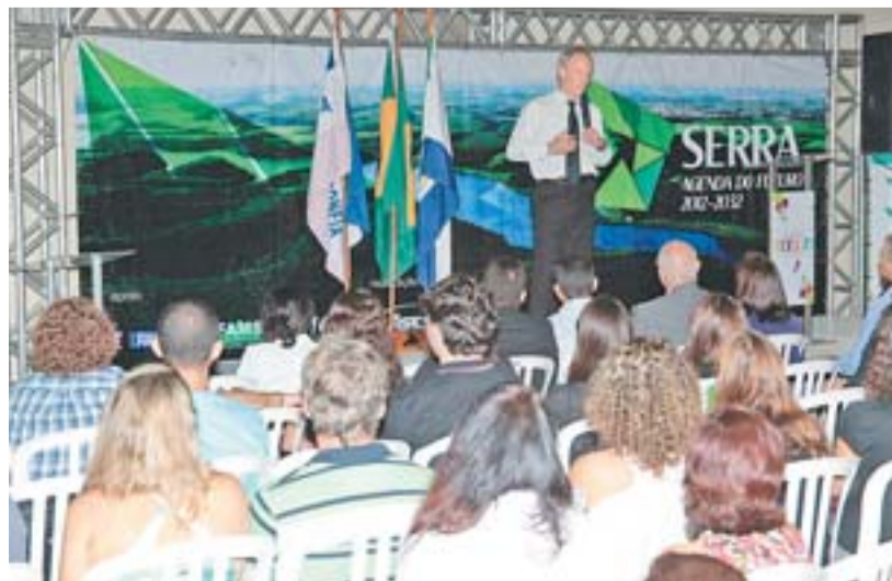
AUDIÊNCIAS PÚBLICAS ajudaram na elaboração dos planos municipais

A prefeitura contratou o arquiteto e urbanista Jaime Lerner que desenvolveu uma série de projetos para a cidade, visando nortear as ações para a construção da Serra do presente e do futuro. O projeto propõe intervenções que vão modernizar a cidade e dar condições para que ela cresça de modo sustentável. Ele está propondo, por exemplo, a construção de um canal navegável no entorno do Mestre Álvaro, Estádio Ecológico em áreas de pedreiras, praias em lagoas, aproveitamento dos fundos de vale para ambientes de lazer, além de tornar a BR-101 – futura Avenida Mestre Álvaro – um importante centro econômico e financeiro de toda a Grande Vitória.