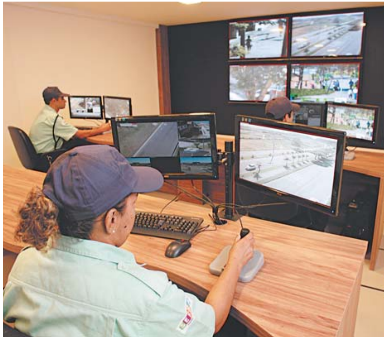
CENTRAL DE VIDEOMONITORAMENTO: são 44 profissionais que se revezam 24 horas para vigiar as ruas da Serra

Para promover a segurança e organização também no trânsito, investimentos têm sido feitos também na instalação de novos semáforos e melhorias na sinalização horizontal e vertical da cidade, dando mais visibilidade e evitando possíveis acidentes. Na avenida Civit, uma das principais da cidade, também foi implantada uma pintura de faixa de retenção exclusiva para motocicletas em semáforos.