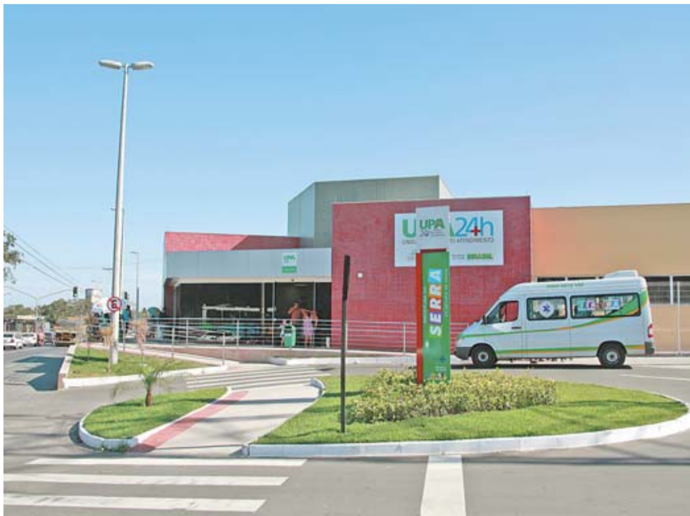
UNIDADE DE PRONTO ATENDIMENTO localizada em Carapina foi inaugurada no ano passado e realiza 520 atendimentos por dia