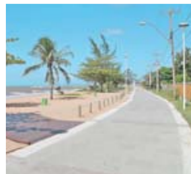
ORLA MANGUINHOS: melhorias