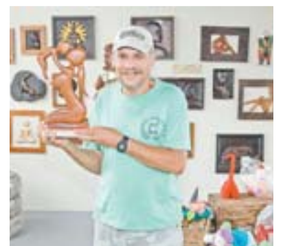
ARTESANATO: espaço garantido

A Prefeitura da Serra abriu este ano 2.500 oportunidades em 57 cursos profissionalizantes para jovens com idade entre 18 e 29 anos.