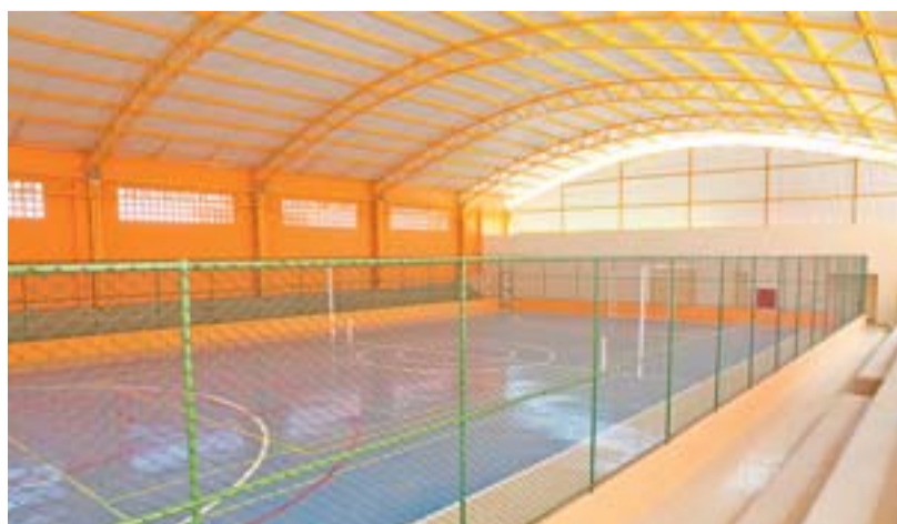
QUADRA DE ESCOLA: inauguração de novos ginásios poliesportivos