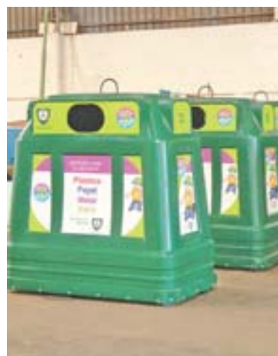
POSTOS de coleta voluntária