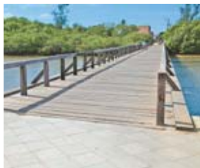
NOVA ALMEIDA: ponte restaurada