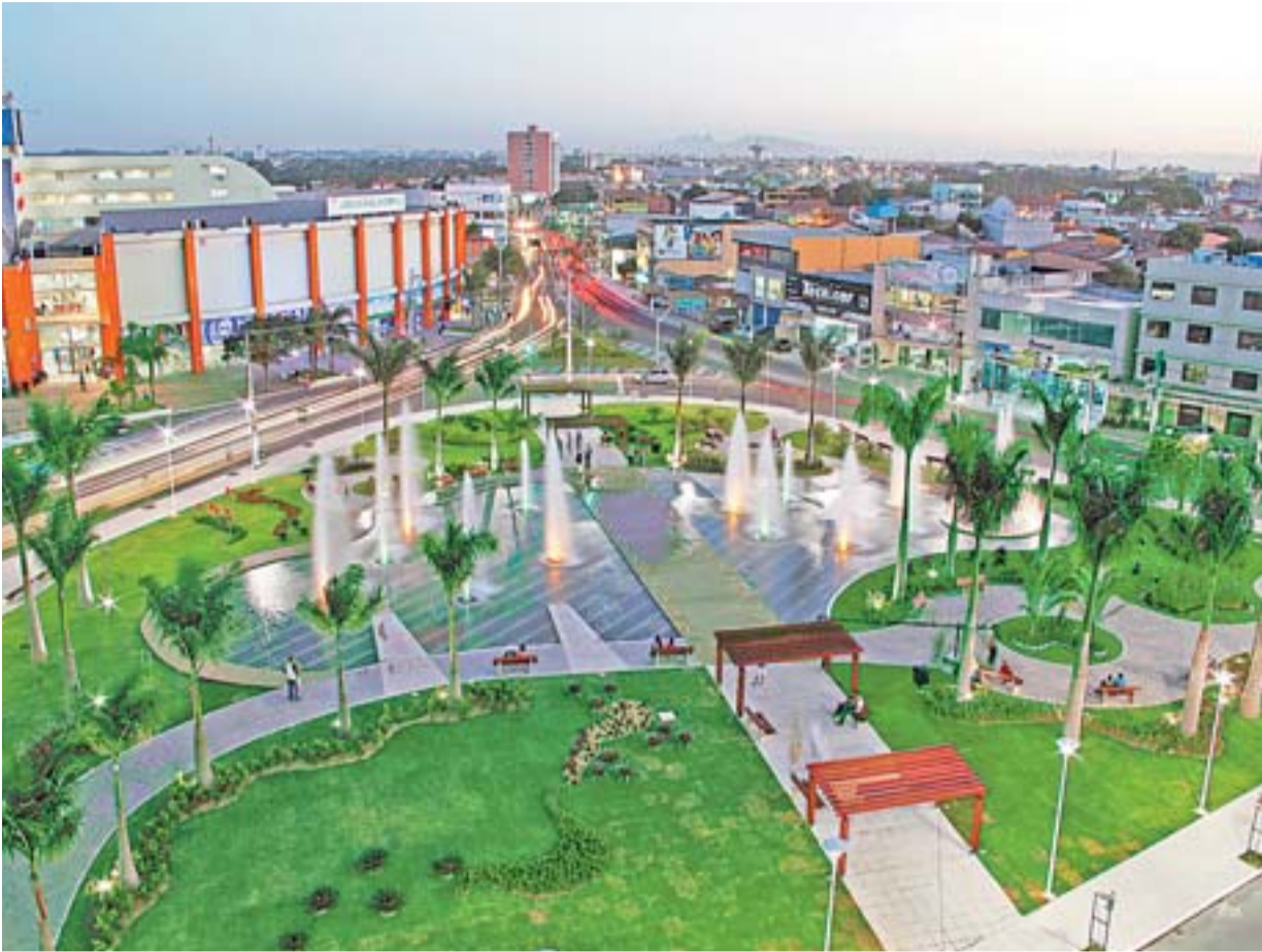
PRAÇA DA LUZ , em Laranjeiras, conta com mobiliário urbano, bicicletário, paisagismo e iluminação especial