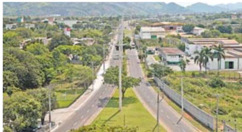
REVITALIZAÇÃO DO CIVIT: grandes vias do município passaram por obras

Com 100 metros de extensão e cinco de largura, a estrutura foi toda retirada e recomposta com madeiras de lei, vindas do Pará e Rondônia. A vida útil das madeiras ultrapassa 70 anos. Também foi colocado corrimão ao longo da ponte.