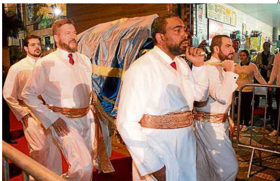
A Arca da Aliança, folheada a ouro, passou coberta pelo meio da multidão

ças folheada a ouro, um símbolo sagrado para o povo de Israel. Levada por sacerdotes, ela saiu de uma igreja da Universal do Brás e seguiu pela rua até o Templo de Salomão. Um coral vindo da África se apresentou na abertura da cerimônia.