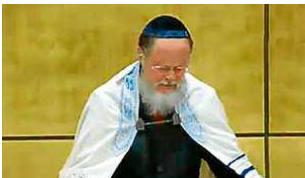
O bispo Edir Macedo deu recado aos governantes

Somente puderam acompanhar a inauguração, do lado de dentro do