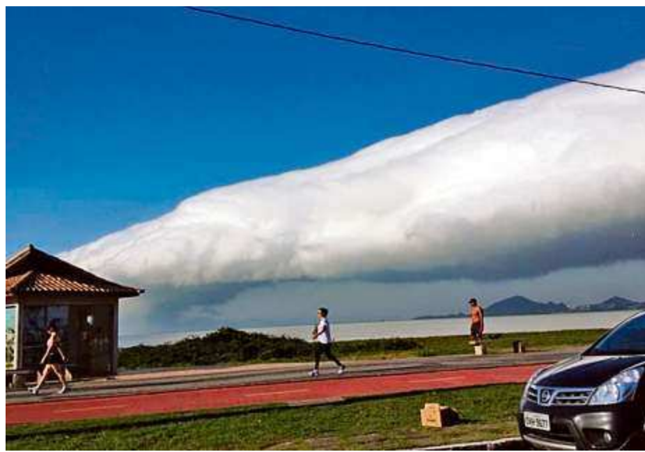
FLASH Orla Quem aproveitava a manhã na Orla de Camburi, em Vitória, foi surpreendido pelo fenômeno.