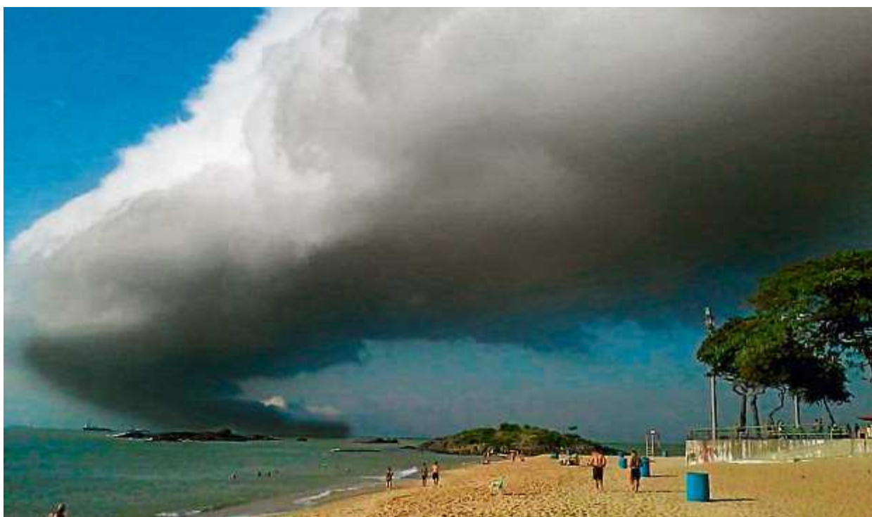
FLASH Caminho Na Praia da Costa, em Vila Velha, a nuvem formou um caminho flutuante cinzento no céu seguindo sobre o mar e a areia da praia.