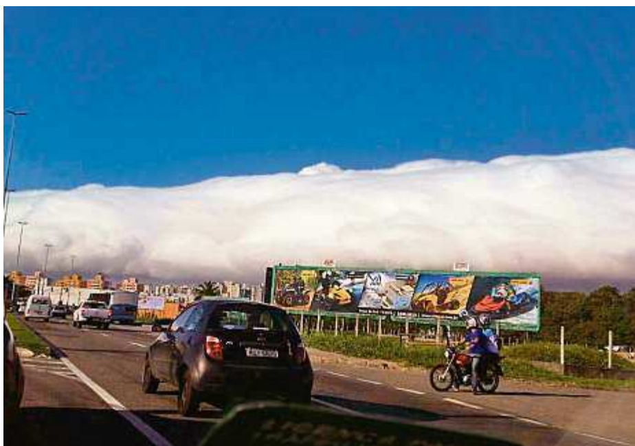
FLASH Fenômeno Muita gente registrou o momento em que a nuvem rolo surgiu no céu da Grande Vitória. Como nesse click em Jardim Camburi, na Capital.