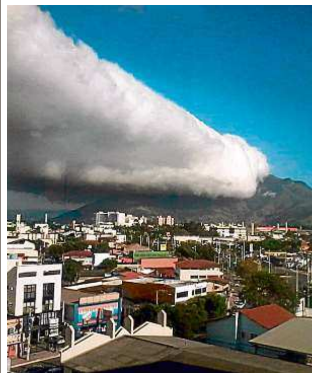
FLASH Mestre Álvaro A vista para o Mestre Álvaro foi bloqueada na Serra.