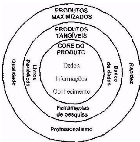
Figura 2 - Níveis de produto

Ao desenvolver um produto, Kotler 3 afirma que o gerente necessita pensar nesse produto em três níveis: produto núcleo ( core do produto ), produtos tangíveis e produto ampliado (produtos maximizados).